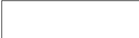
Pieczętka firmowa (1)